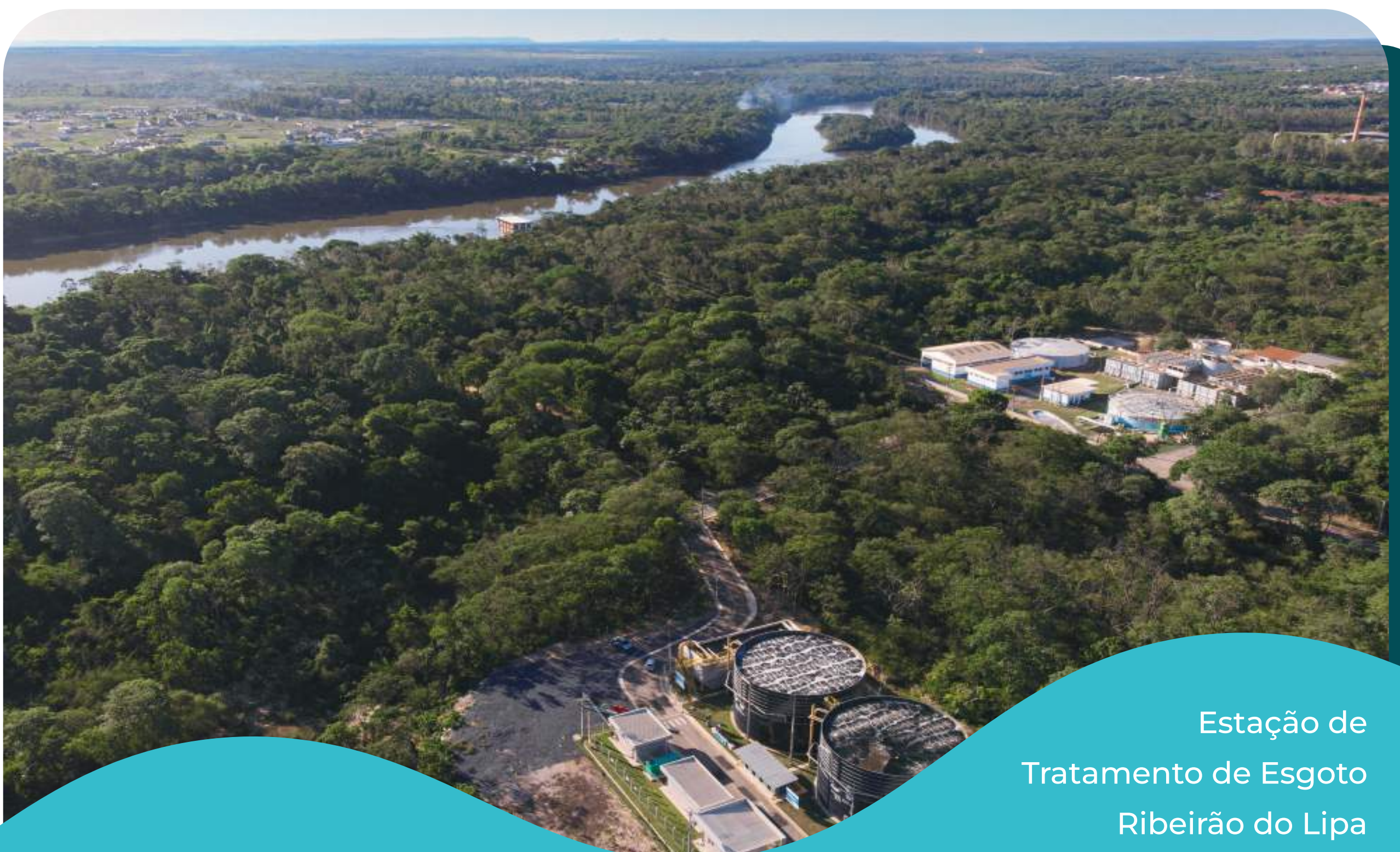
Estação de Tratamento de Esgoto Ribeirão do Lipa

Av. Mario Palma - Ribeirão do Lipa, Cuiabá - MT. (65) 3617-1482.