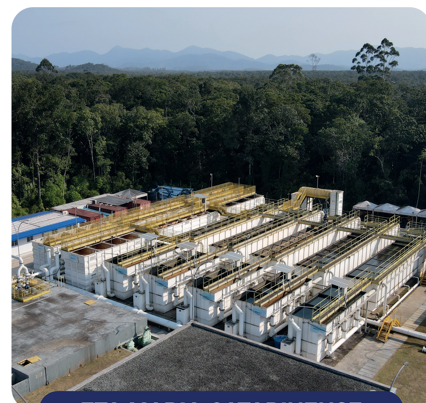
ETA MARIA CATARINENSE

Rua Mariana Michels Borges, 201 - Itapoá - SC Tel.: (47) 3443-8800